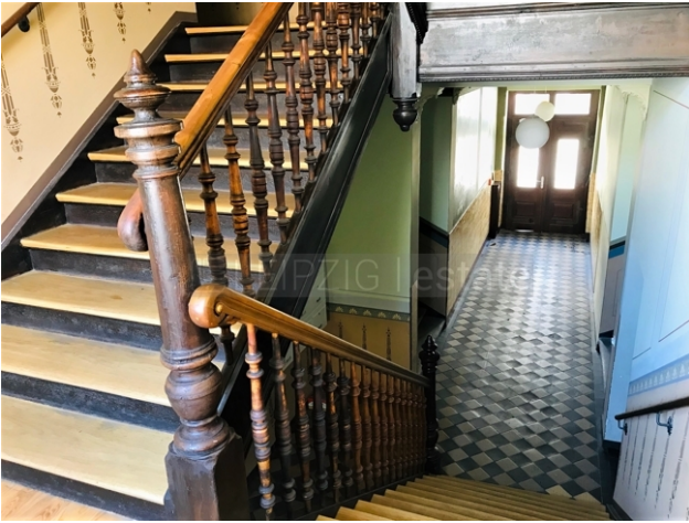
Treppenhaus zum Hausflur