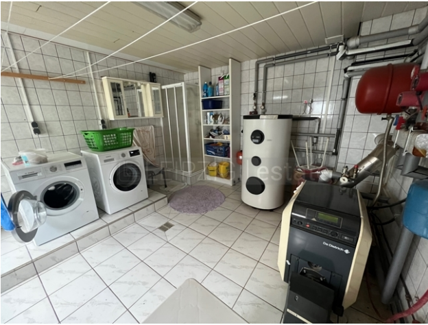
WaMa-Raum mit Dusche im EG Haus 2