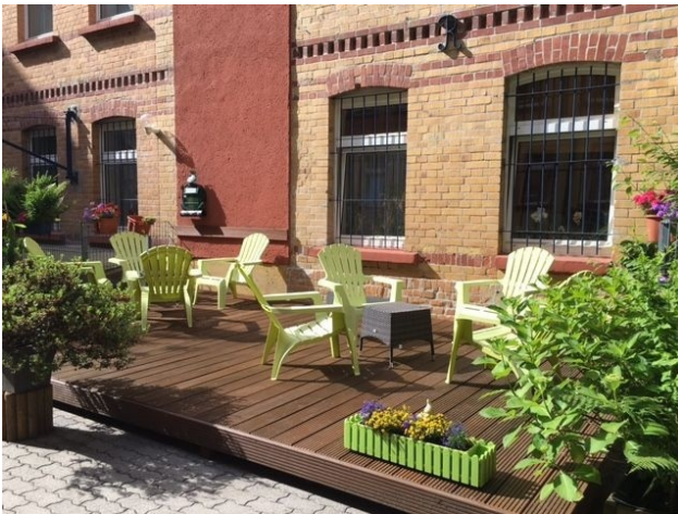
Ansicht Terrasse 3