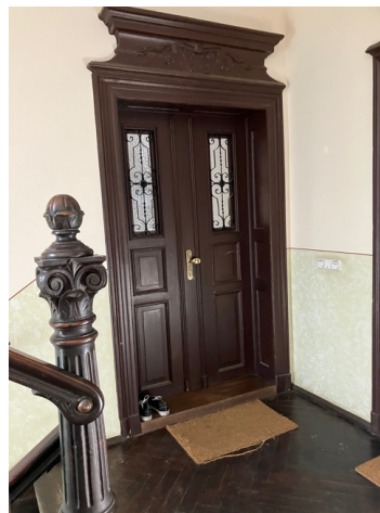
WE Eingang 1 OG links