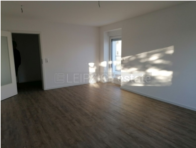
Beispiel Ausstattung nach Fertigstellung 1