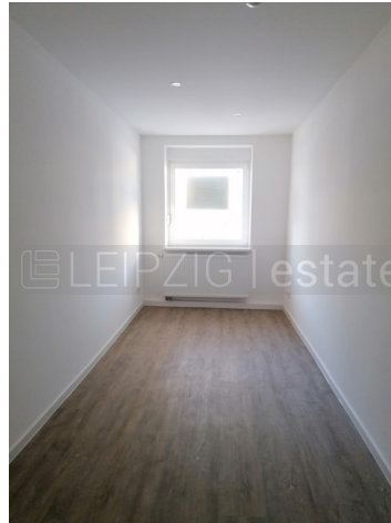
Beispiel Ausstattung nach Fertigstellung 2