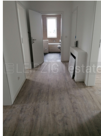
Beispiel Ausstattung nach Fertigstellung 6