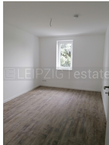
Beispiel Ausstattung nach Fertigstellung 8