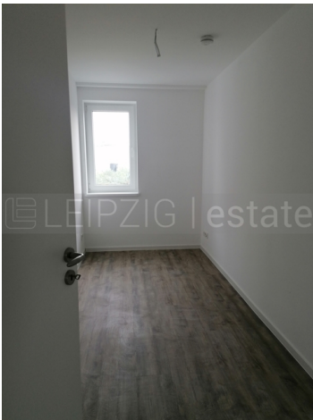
Beispiel Ausstattung nach Fertigstellung 7