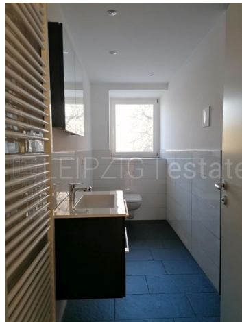
Beispiel Ausstattung nach Fertigstellung 4