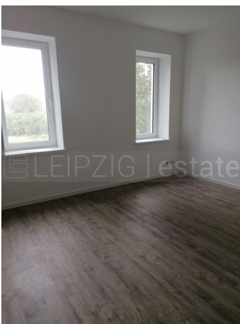
Beispiel Ausstattung nach Fertigstellung 9