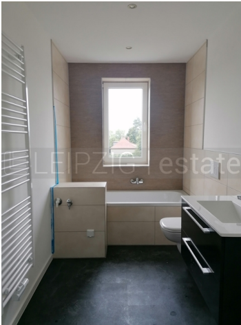
Beispiel Ausstattung nach Fertigstellung 5