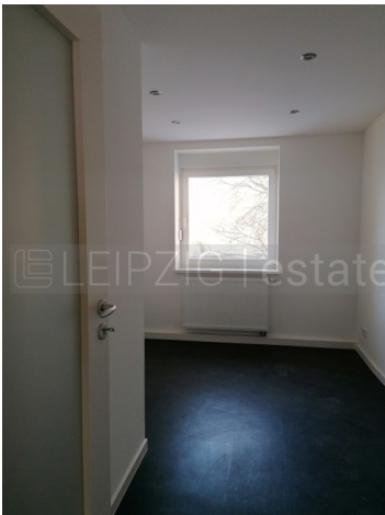
Beispiel Ausstattung nach Fertigstellung 3