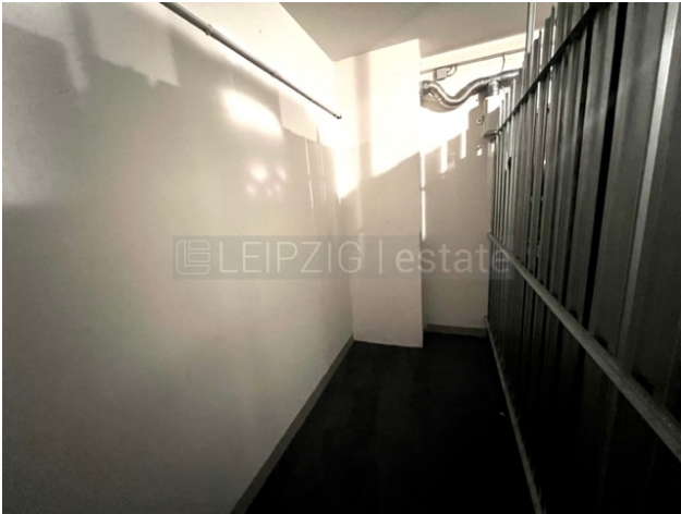
Abstellkammer auf gleicher Etage