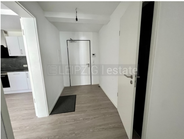
Flur zum Eingang