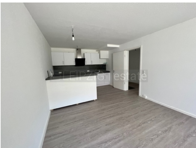
Wohnzimmer zur offenen Küche