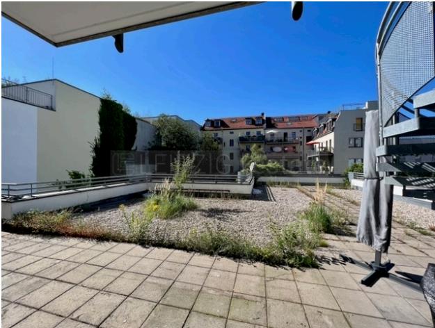
Terrasse von Terrassentür