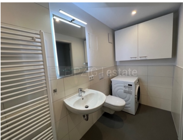
Bad, WaMa gegen Ablöse