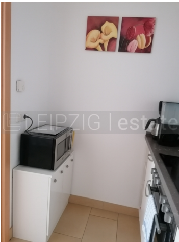
Küche linke Seite