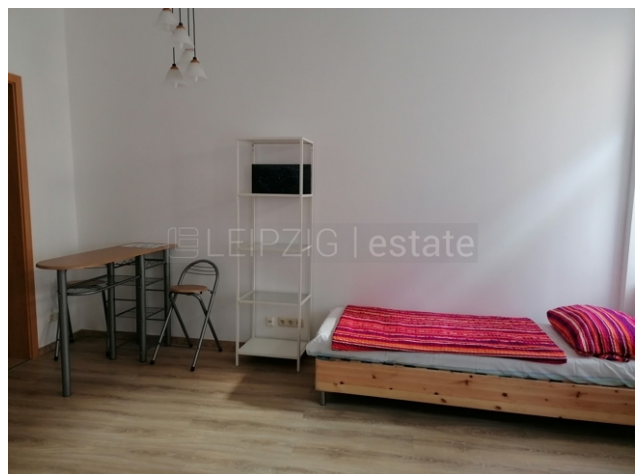
Wohnzimmer linke Seite