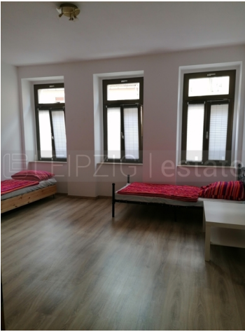
Wohnzimmer rechte Seite