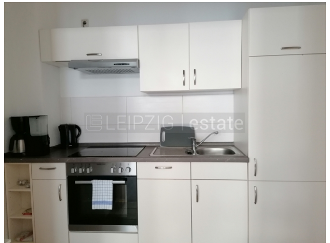
Küche mit EBK