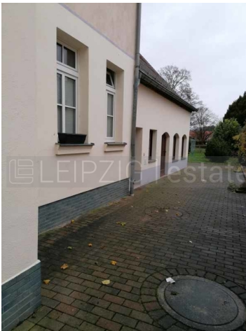
Hof mit Fahrradschuppen (links hinten)