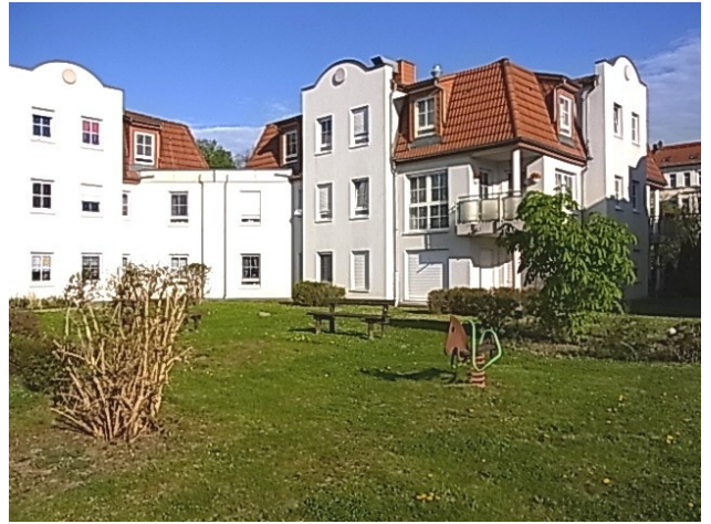
Grünbereich hinter dem Haus