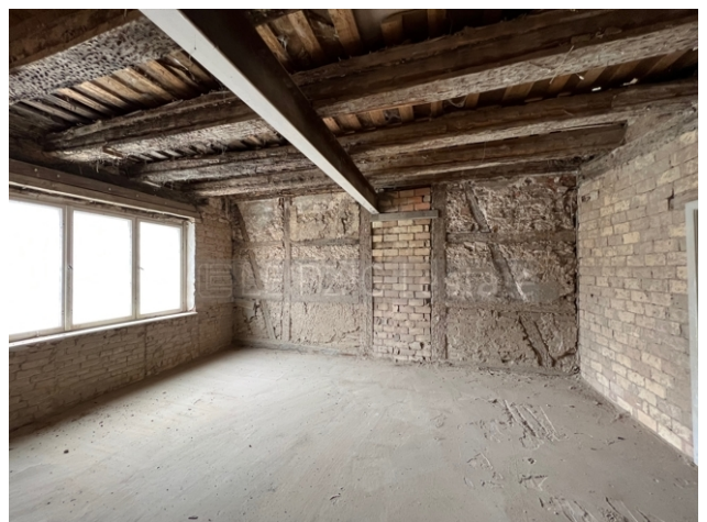
Entkernte Fläche Vorderhaus