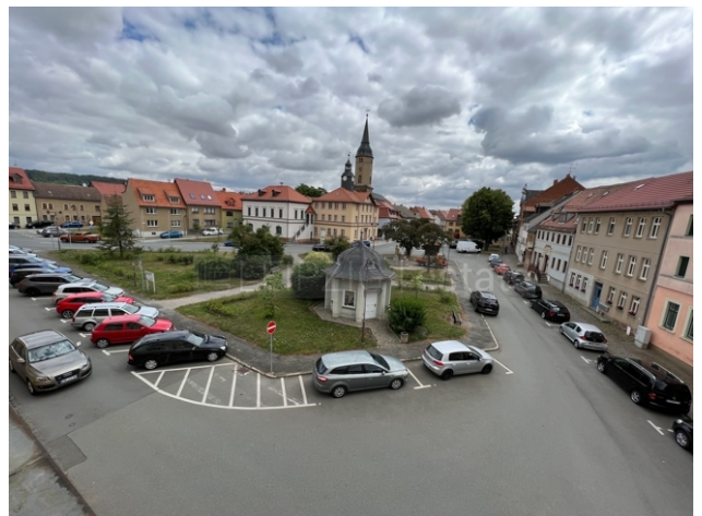
Blick vom Haus zum Marktplatz