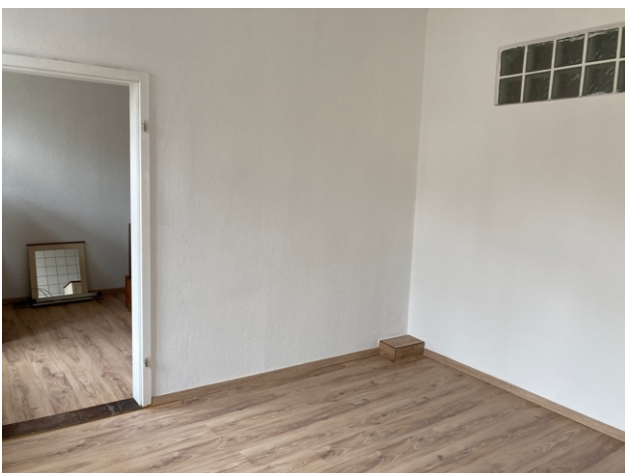
Zimmer links Straße