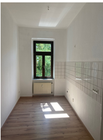
Hofzimmer (ehem. Küche)