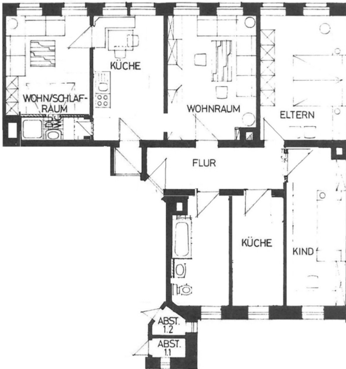
Grundriss 1OG Mitte_rechts