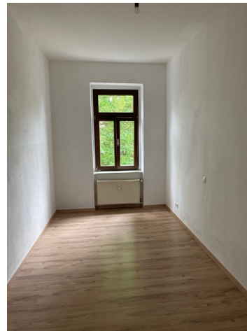
Zimmer Hof (ehem Küche)