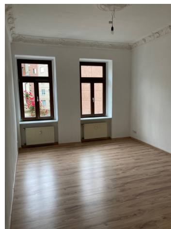
Zimmer rechts Straße