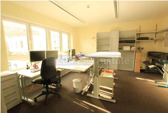
Büro 1, 24qm