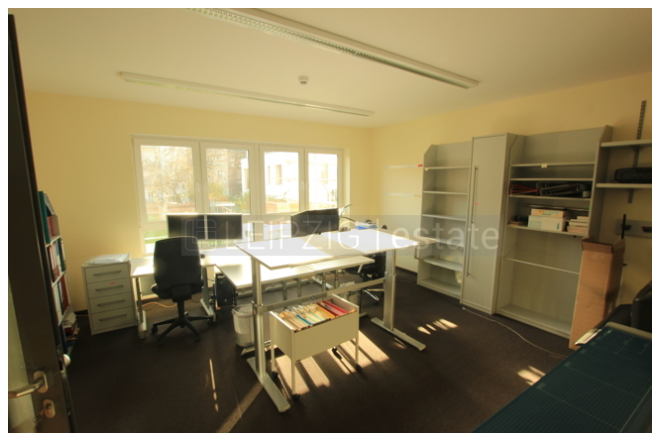
Büro 1, 24qm