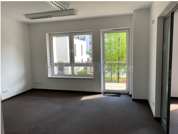
Büro 2 Leer