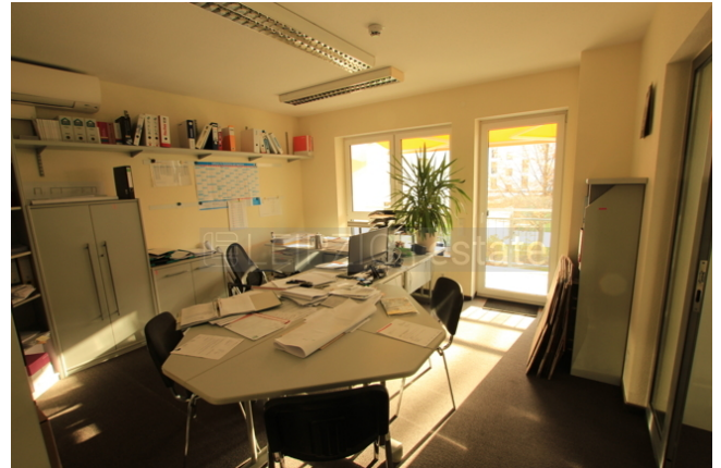
Büro 2, 18,7qm mit Balkon, zum Balkon