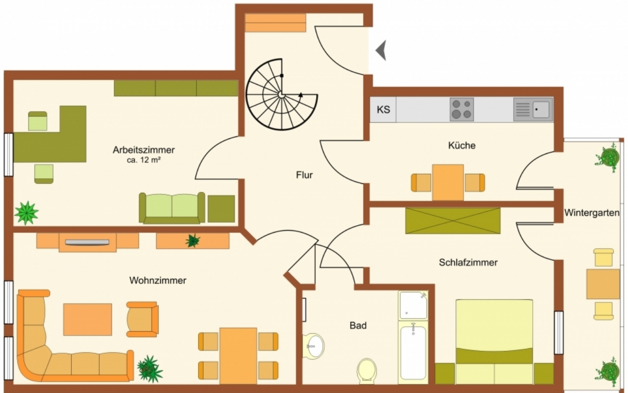
Grundriss untere Ebene