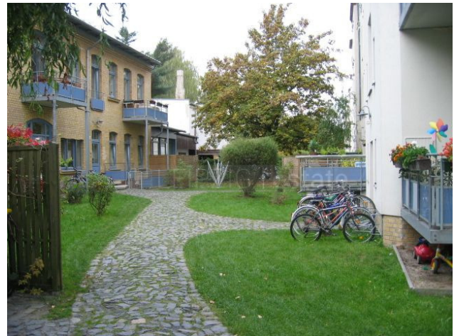
Ansicht Innenhof mit Hinterhaus