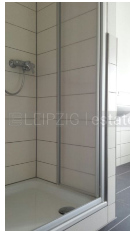
weitere Ansicht Dusche